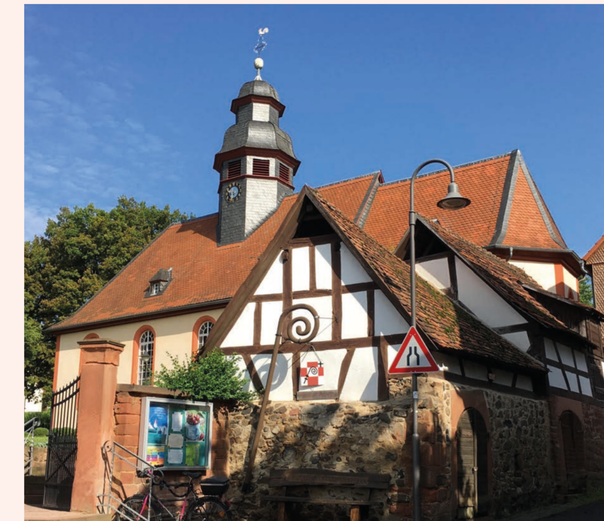
Düdelshelm Kirche und Keller

D üdelshelm gehört zu den ältesten Orten rund um den Glauberg. Die Beigaben aus dem Grab einer adeligen Dame weisen in die Zeit um 650 n. Chr. Im Jahre 792 findet der Ort in einer Schenkung an Kloster Lorsch erstmals Erwähnung. Die Kirche wird schon 1219 genannt. 1601 kam Düdelshelm zur Grafschaft Ysenburg-Büdingen. Von dem einst großen jüdischen Gemeindeteil zeugen noch zwei Friedhöfe. Der seit 1781 abgehaltene Düdelshelmer Markt zählt zu den größten und beliebtesten Volksfesten der Region. Eine gute Infrastruktur gewährleisten ein hohes Maß an Daseinsvorsorge für die mehr als 2.700 Einwohner. Düdelshelm ist der größte Ortsteil von Büdingen. Ein Museumsraum erinnert an „die gute alte Zeit“.