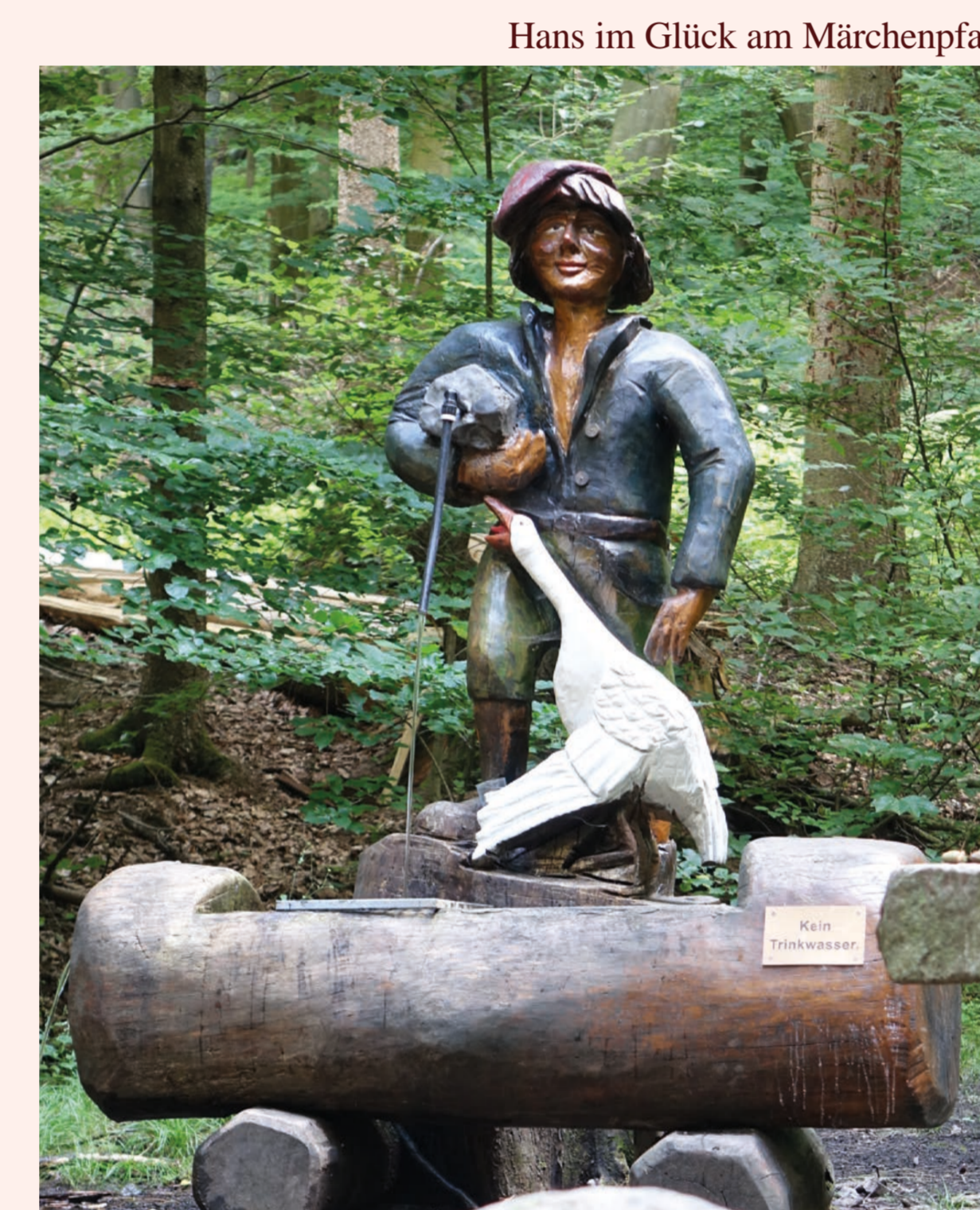
Hans im Glück am Märchenpfad

A uf mehreren Wander- und Radwegen lässt sich die abwechslungsreiche Natur aktiv erleben. Die Bonifatius-Route führt von Südwesten kommend vom Düdelshelmer Wald her entlang des Märchenpfades durch den Ort hoch zum Hausberg „Steinern“ mit seinen mächtigen Basaltfelsen. Vom Aussichtsturm aus erschließt sich der Weg nach Norden zum Glauberg, dem uralten keltischen Fürstensitz.